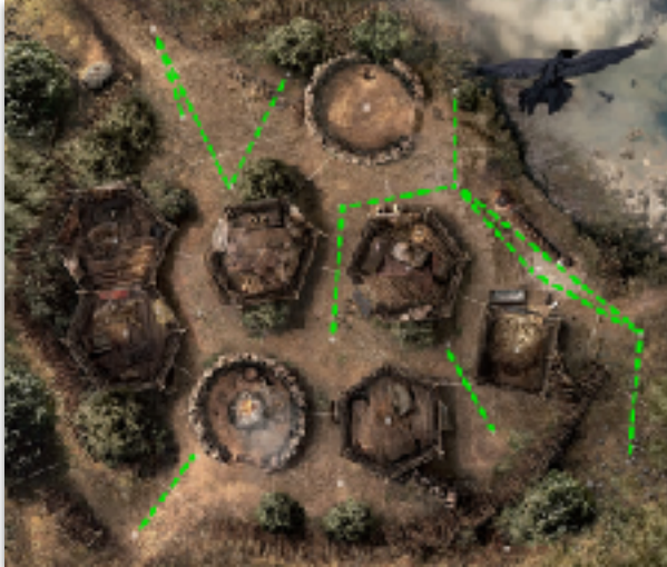
En vert les lignes de vues possible